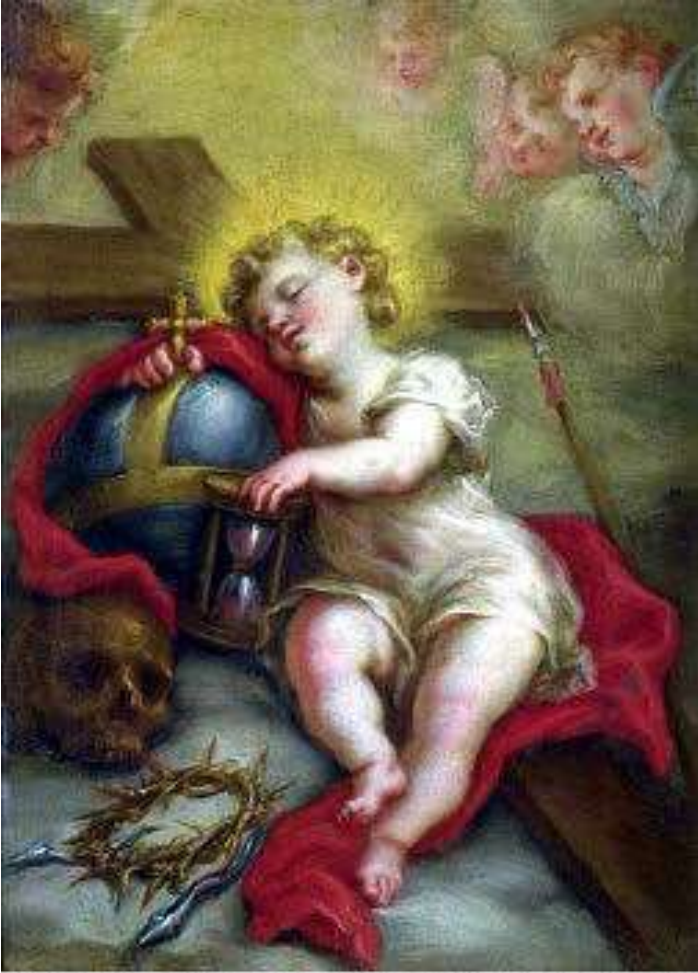
Antonio Ligabue, regale del Barocco, Gesù bambino regge il mondo e riposa sulla Croce, Cori, privata

L'Amore, che è in noi, deve essere più grande del male che compiamo. Questo ha detto e fatto Gesù: Padre, perdonali, perché non sanno quello che fanno. Luca 23, 34.